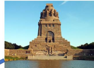
Völkerschlachtdenkmal, Straße des 18. Oktobers 100

Met de entréekaart van de Buchmesse kun je die dag in de stad gratis gebruik maken van ov (Leipziger Verkehrsbetriebe)