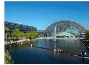
Leipziger Messe, Messe-Allee 1, Glashalle (Eingang West)