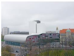
Deutsche Nationalbibliothek, Deutscher Platz 1