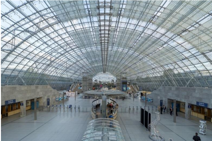
Ingang Glashalle - Eingangshalle West, met links Garderobe West 2, en rechts Garderobe West 1; trefpunten om 13:30 uur voor de middagexcursies naar het Völkerschlachtdenkmal en de Deutsche Nationalbibliothek