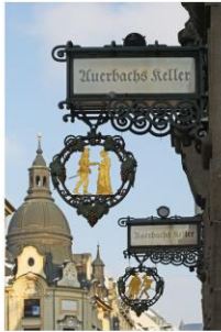
Auerbachs Keller, Grimmaische Straße 2-4, (ingang in Mädler-Passage)