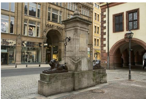
Löwenbrunnen in de Grimmaische Straße, om 17 uur trefpunt voor de stadswandeling; op de achtergrond de ingang van de Mädlerpassage met Auerbachs Keller, alwaar vanaf 18:30 wordt gedineerd